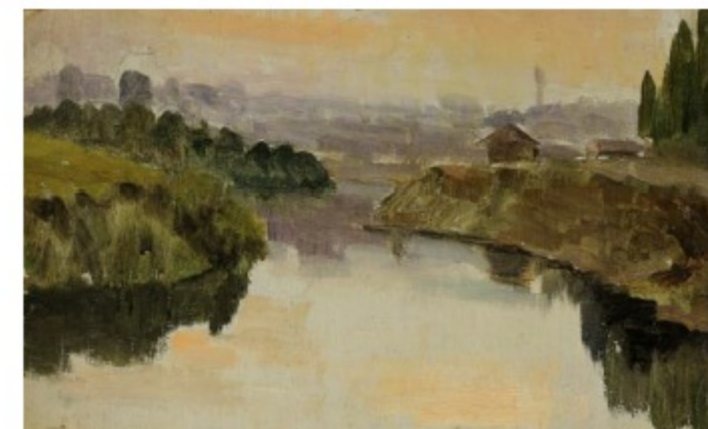
Баяндин А.Д. Раннее утро на реке Масло, ДВП. Б/д КПОГА, Ф.Р-171, Оп.1, Д.47, Л.6