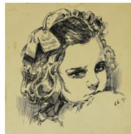
Баяндин А.Д. Голова девочки Тушь, бумага. 1957 г. КПОГА, Ф.Р-171, Оп.1, Д.47, Л.14