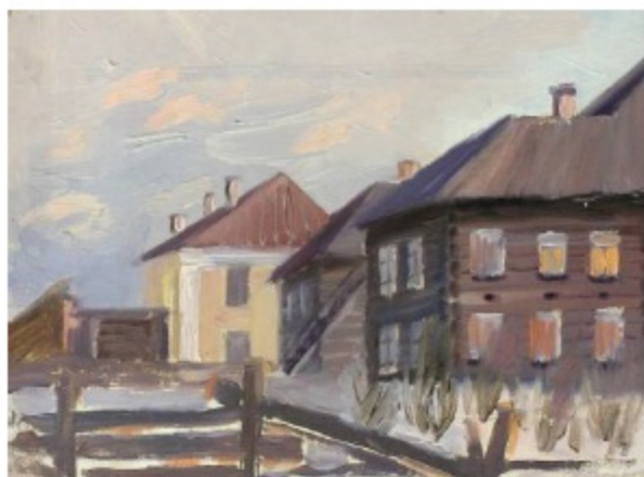
Баяндин А.Д. Улица ДВП, масло. Б/д КПОГА, Ф.Р-171, Оп.1, Д.47, Л.22