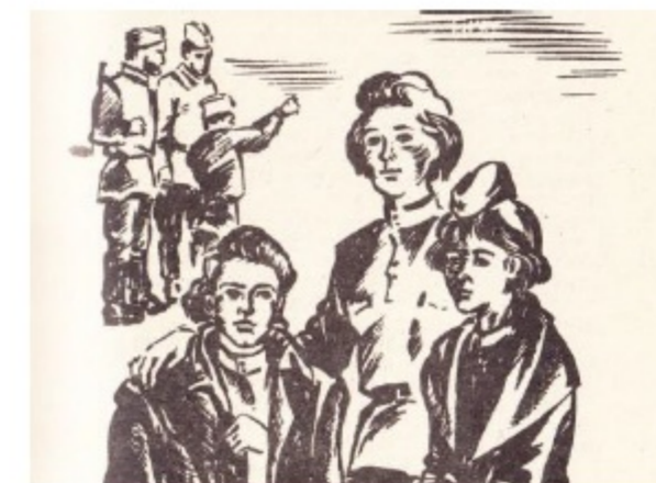
Рисунки Н.Ю. Новиковой к сборнику произведений А.Д. Баяндина и к повести «Девушки нашего полка» Кудымкар: К-Перм. кн. изд-во, 1994 г. КПОГА, Ф.Р-171, Оп.1, Д.1, Л.85об.

первое произведение в отечественной литературе, где должным образом запечатлена участь женщины на войне.