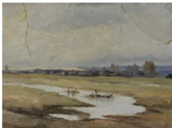
Баяндин А.Д. Осенний пейзаж ДВП, масло. Б/д КПОГА, Ф.Р-171, Оп.1, Д.47, Л.9

Анатолий Денисович любил жанр пейзажа. Тут сказалась любовь к природе, привитая походами на рыбалку с отцом и братьями в детские годы.