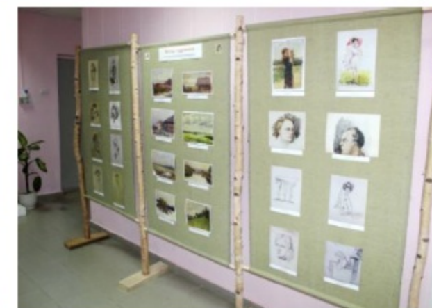
Выставки документов из личного фонда А.Д. Баяндина в читальном зале и холле окружного архива. г. Кудымкар, 2019 г.