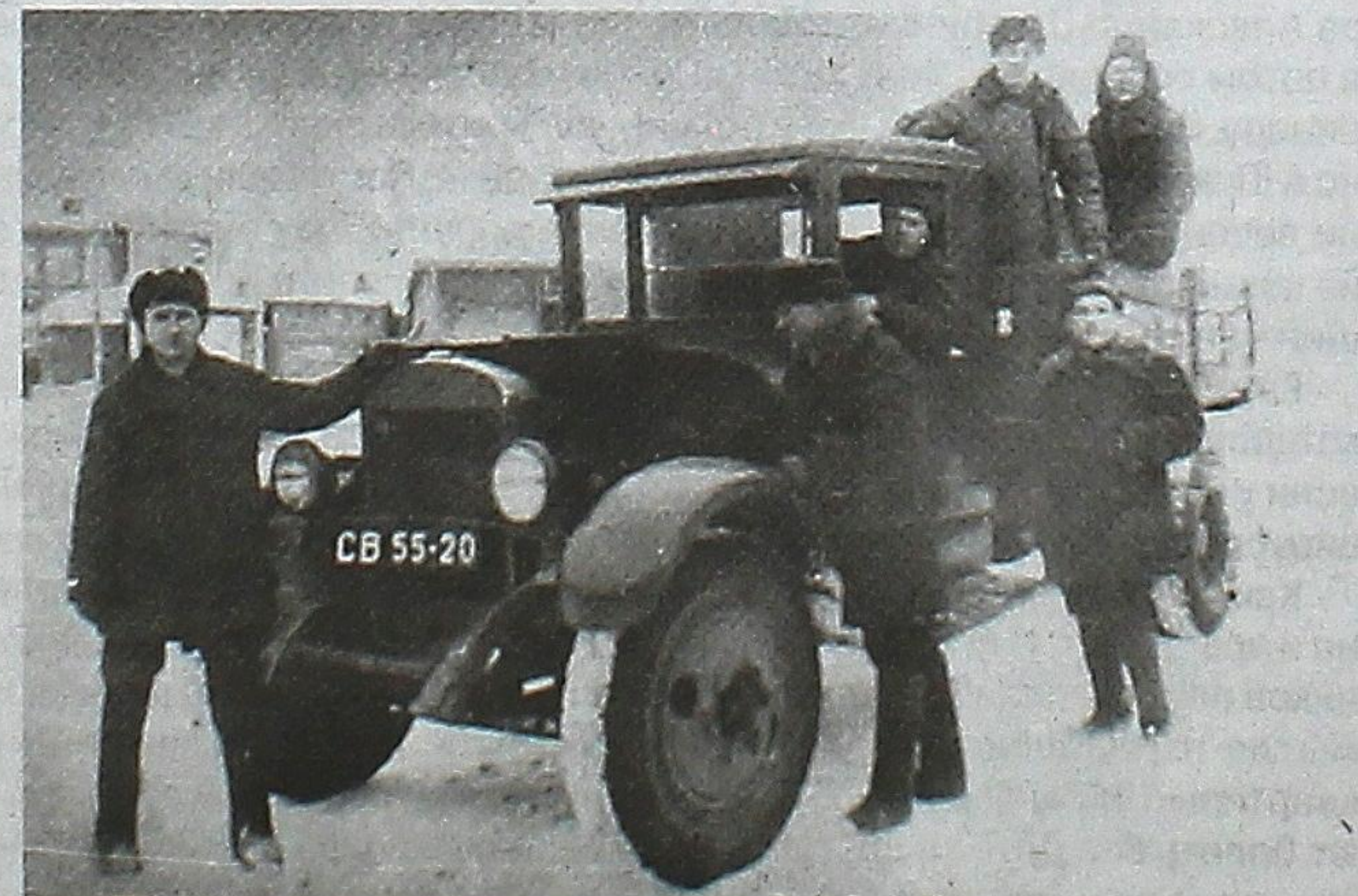
Автомашина ГАЗ-АА (полуторка). Репродукция