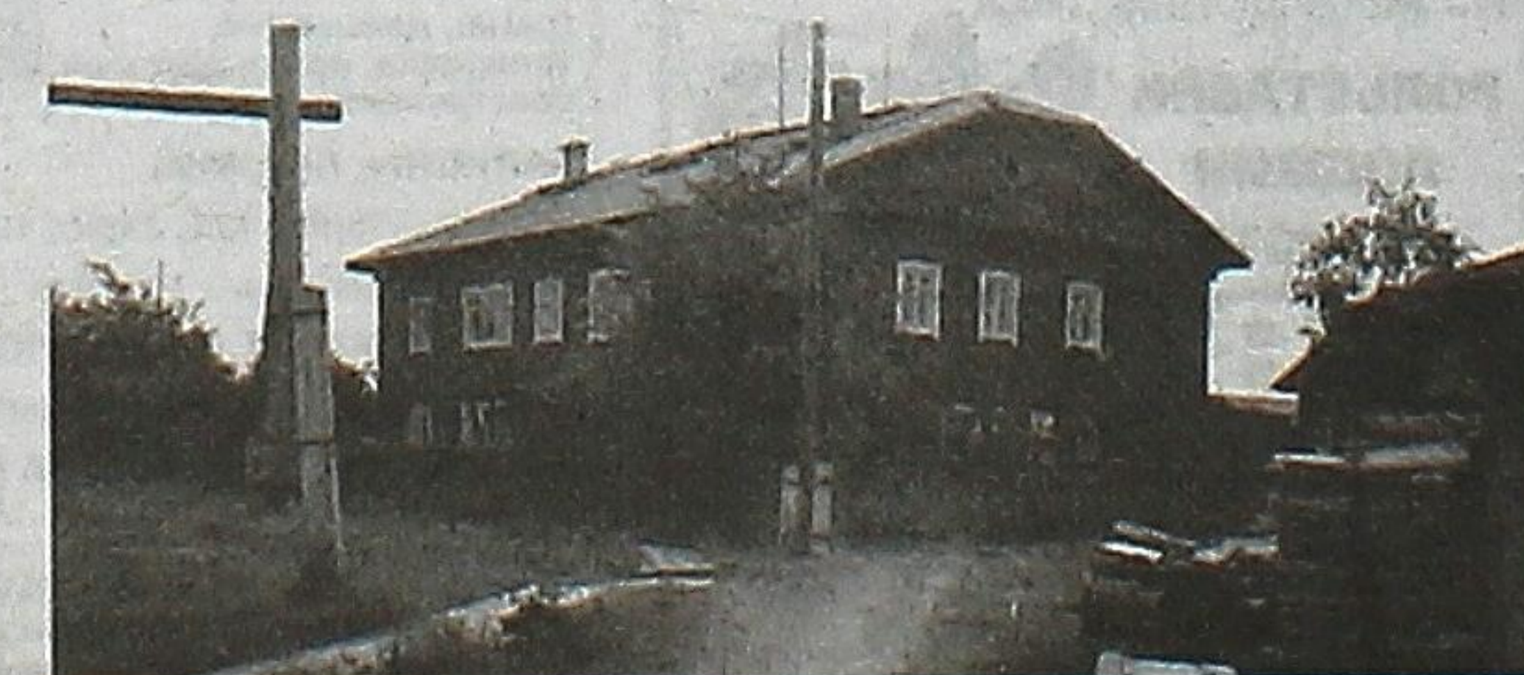
Общий вид здания Кудымкарского мехлесхоза им. Н. И. Кузнецова, 03.07.1987