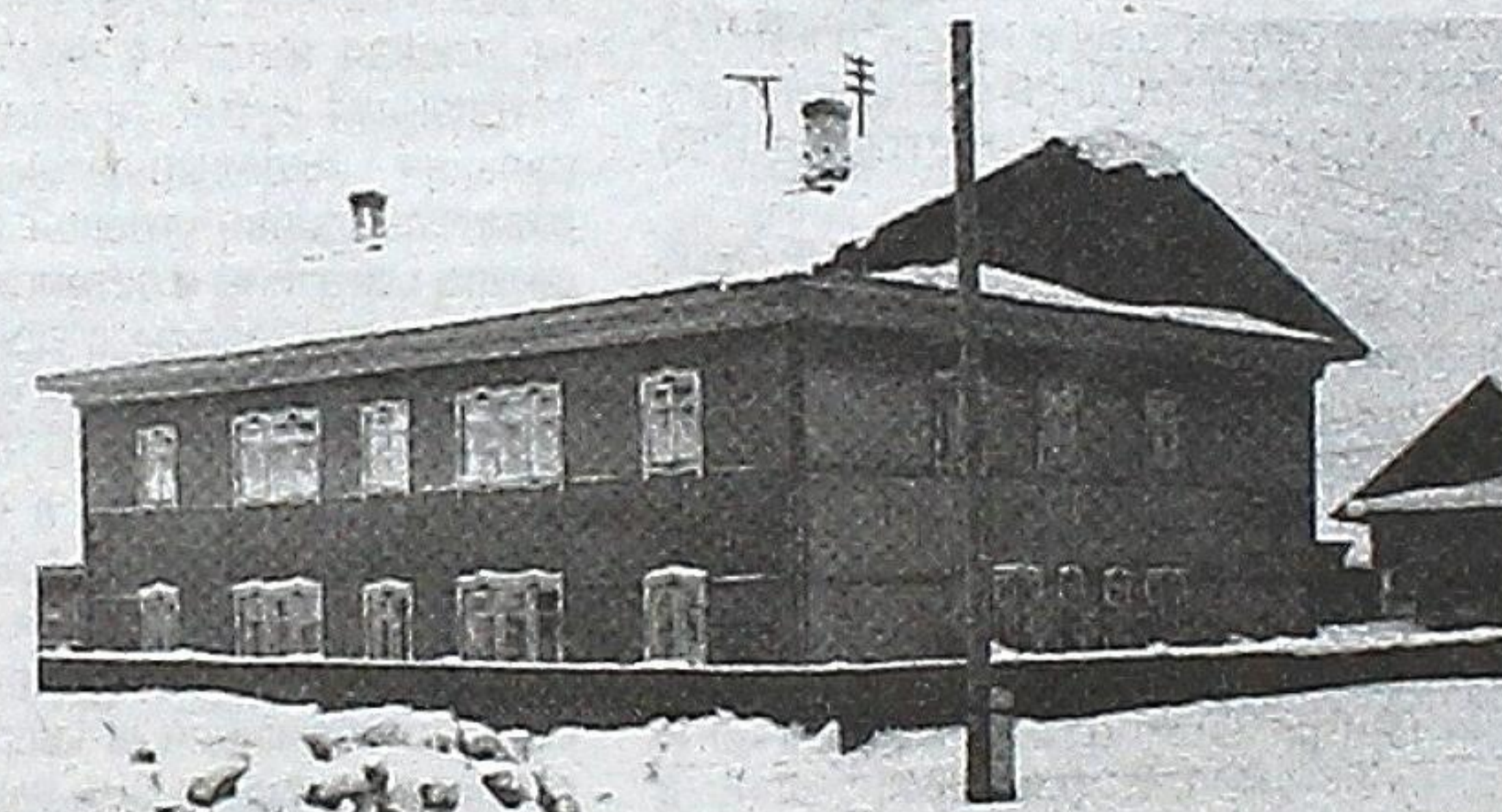
Здание конторы Кудымкарского лесхоза, носящего имя Героя Советского Союза Н. И. Кузнецова, 19.02.1976