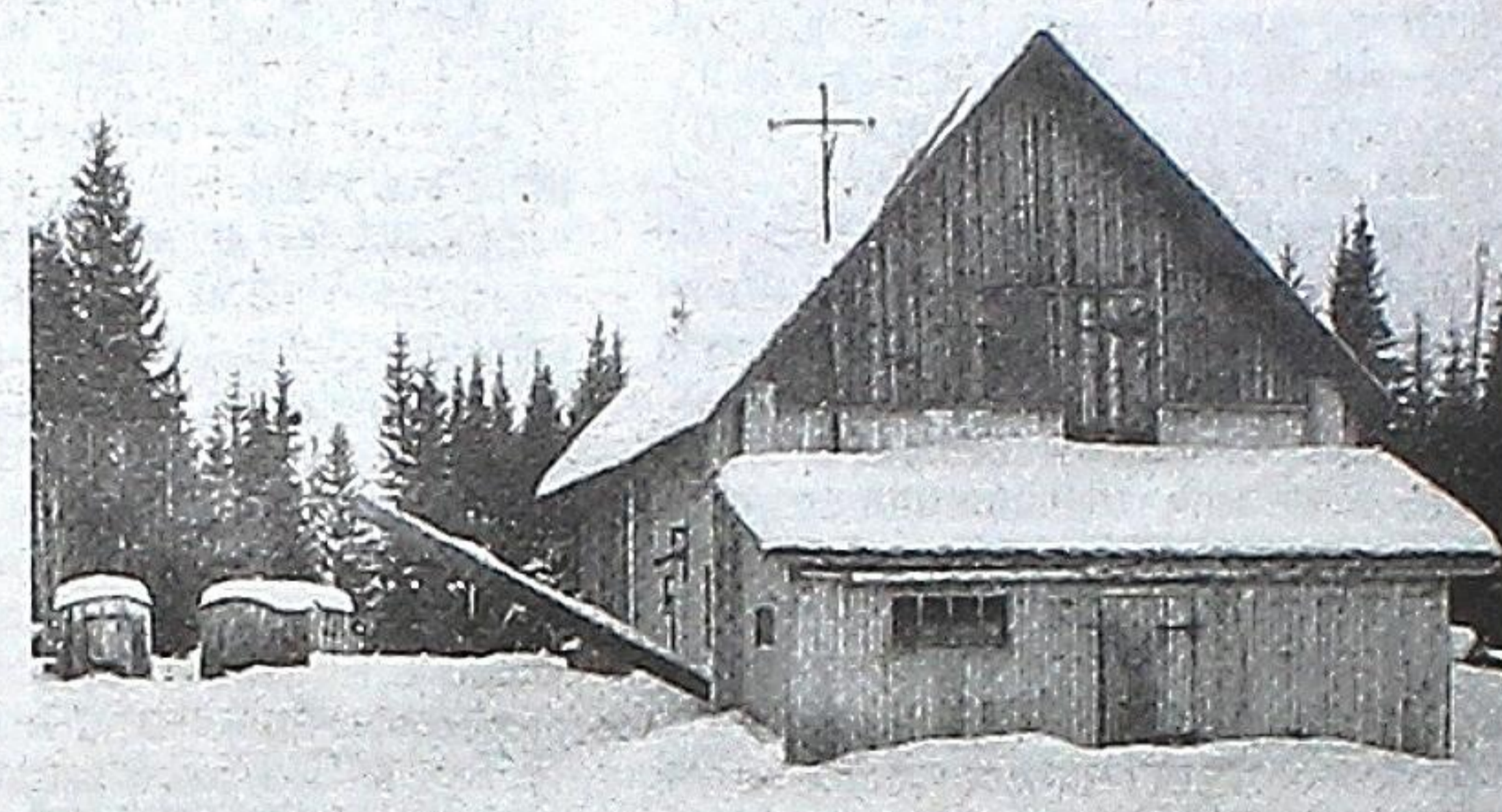
Здание шишкосушилки Кудымкарского лесхоза в д. Новоселово, 16.02.1980