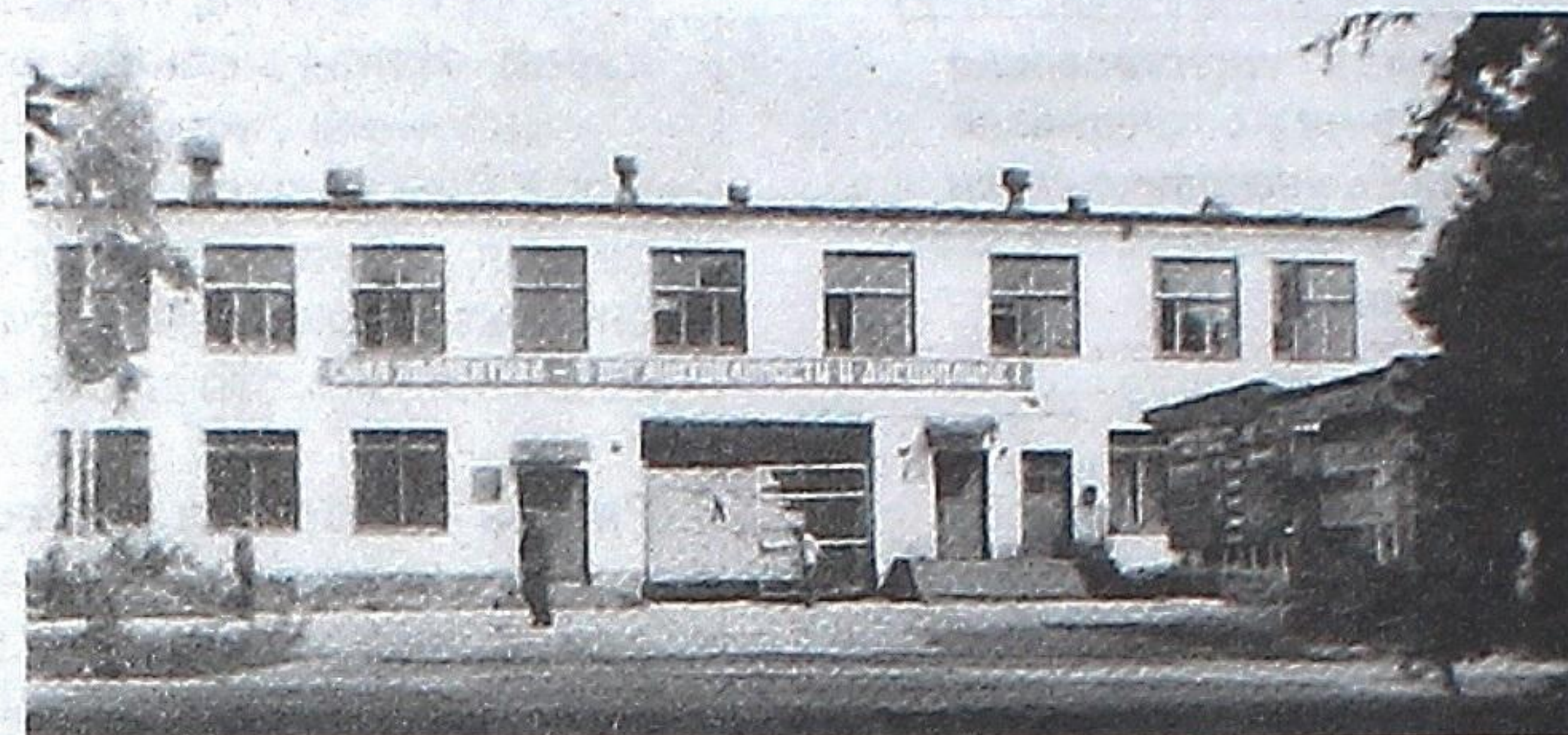
Общий вид здания Кудымкарского ремонтно-механического завода, проходная. (ул. М. Горького, 38), 03.07.1987