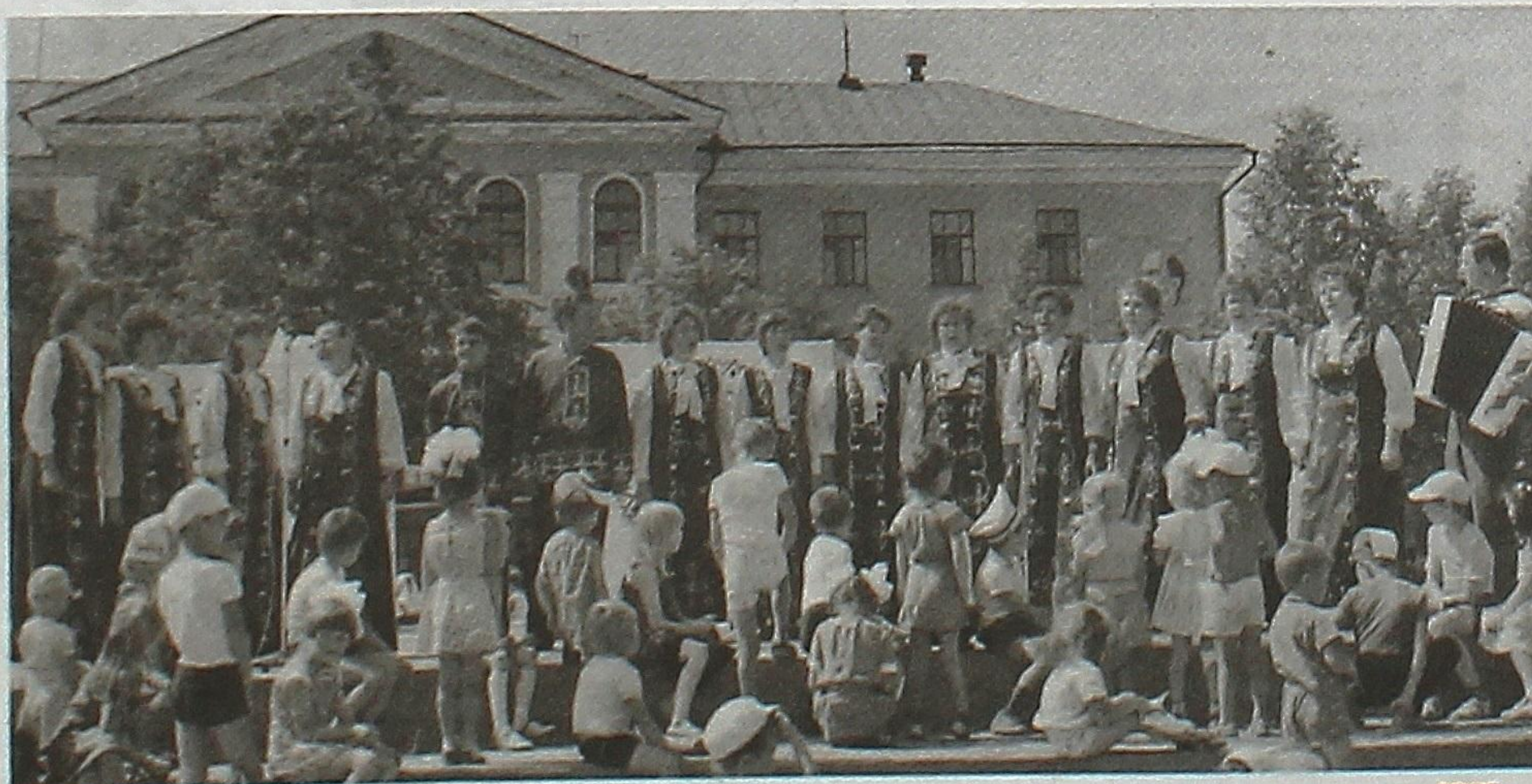
Хор Ремонтно-механического завода на городской площади в день молодежи, июнь 1986 г.