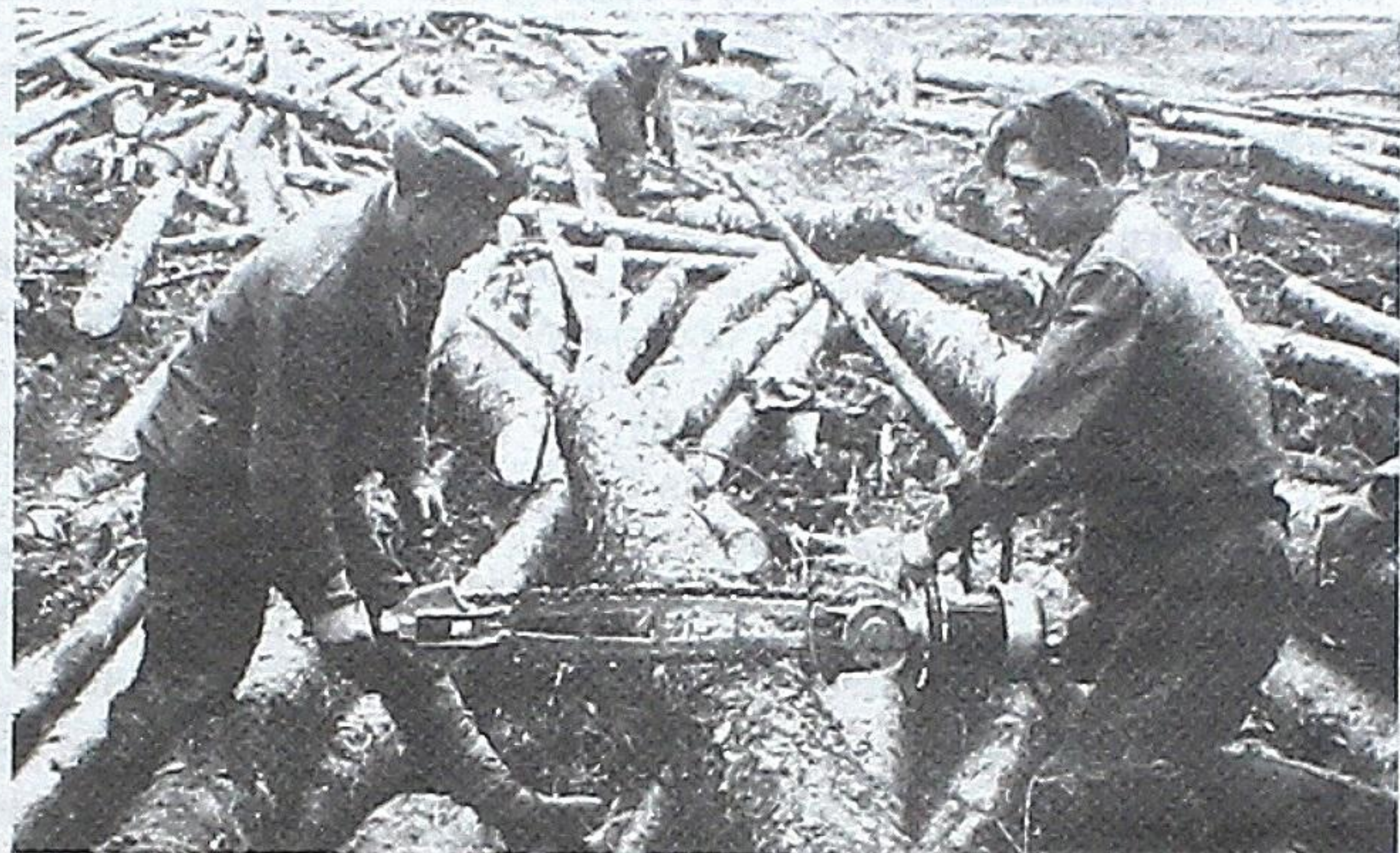
Валка леса первыми электропилами на Пожвинском лесоучастке Юсьвинского района, октябрь 1947 г.