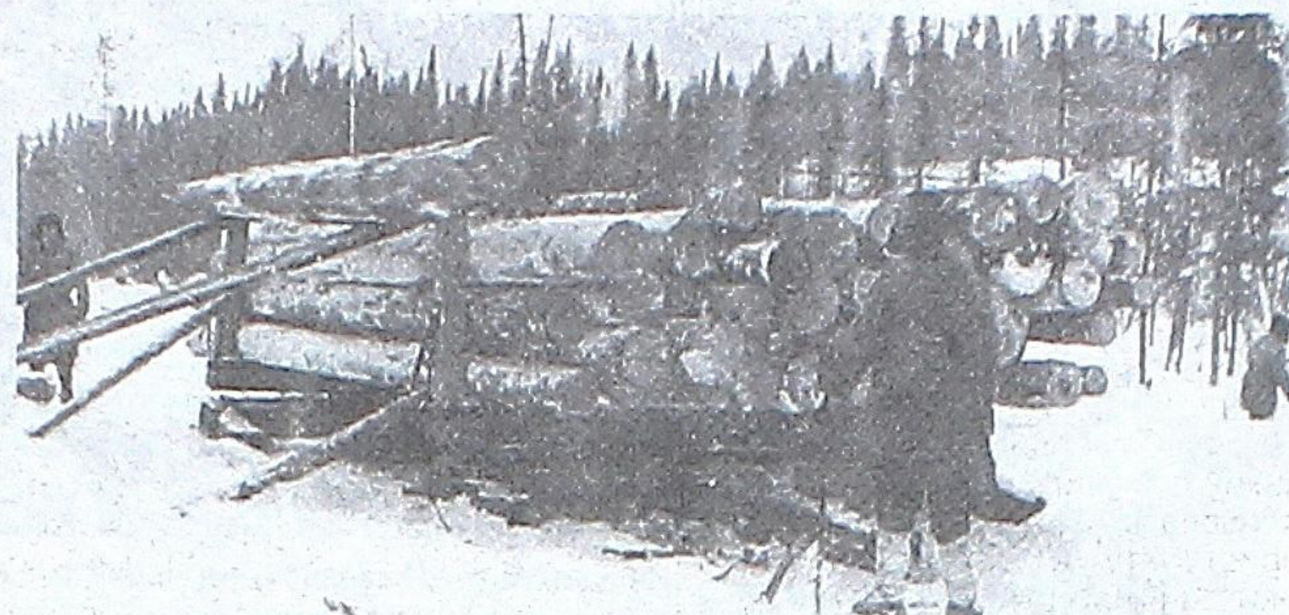
Конная погрузка леса на тракторные однополосные сани системы «Шабурка» в Крохалевском ЛПХ комбината «Комипермлес», 25. 12. 1954