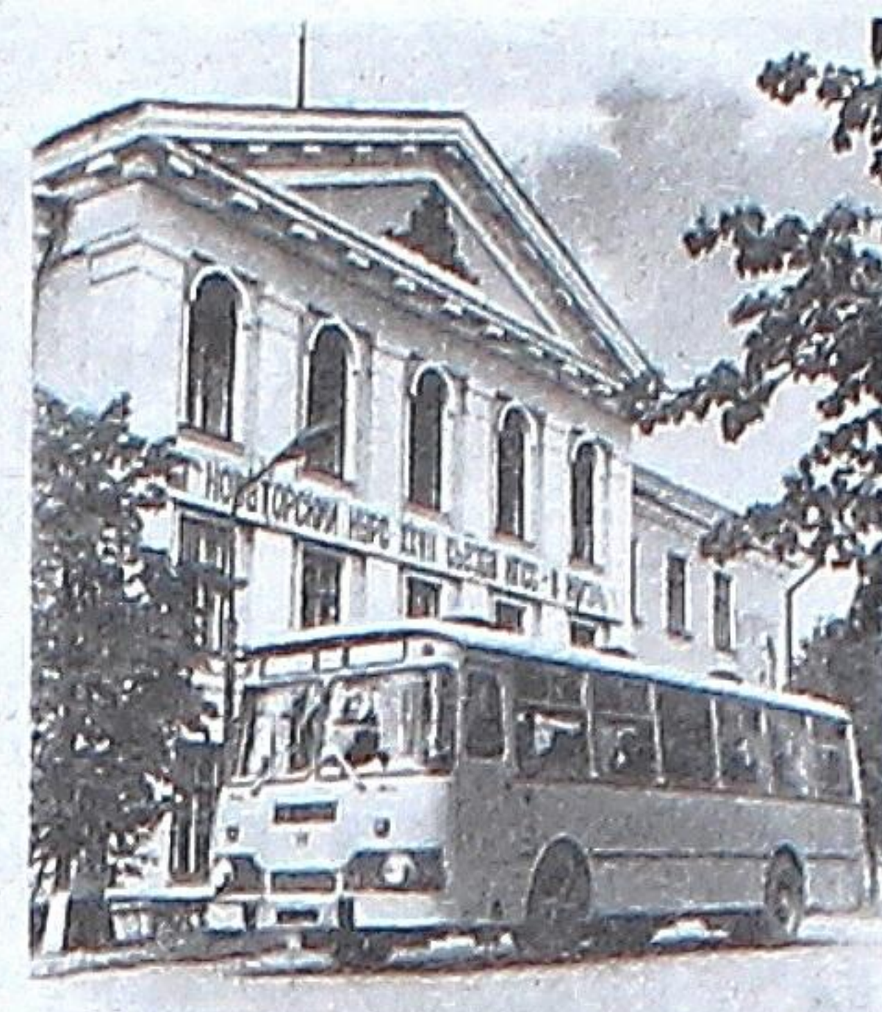
Здание конторы объединения Комипермлес и треста Комипермлесстрой по ул. Лихачева, 54. Общий вид, 1988 г