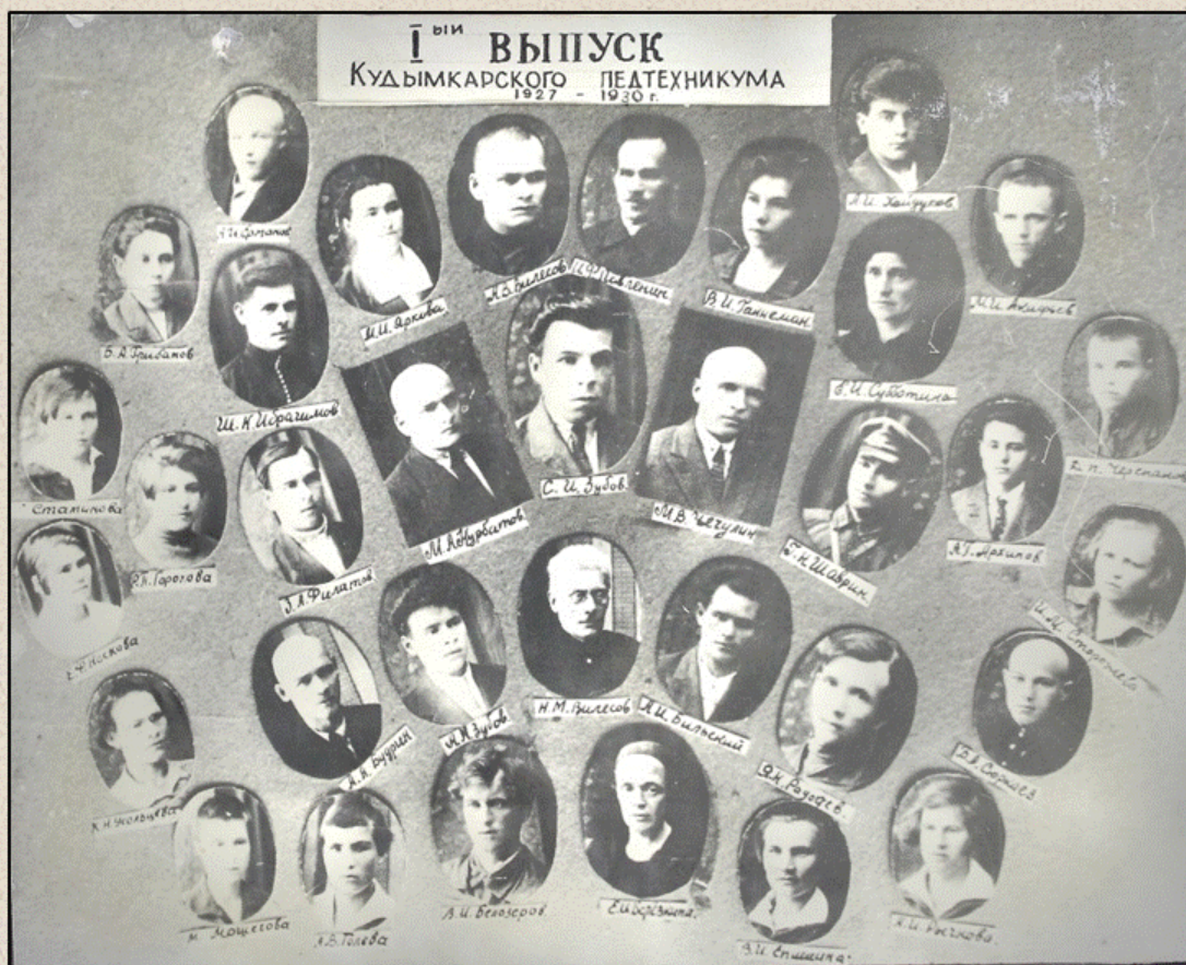
I выпуск Кудымкарского педтехникума 1927-1930 гг. Фрагмент альбома из музея Кудымкарского педучилища "История комсомольской организации педучилища"