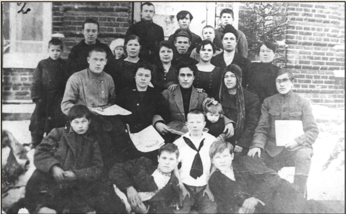
Комсомольцы с. Юрда после собрания членов организации, 1924 г.