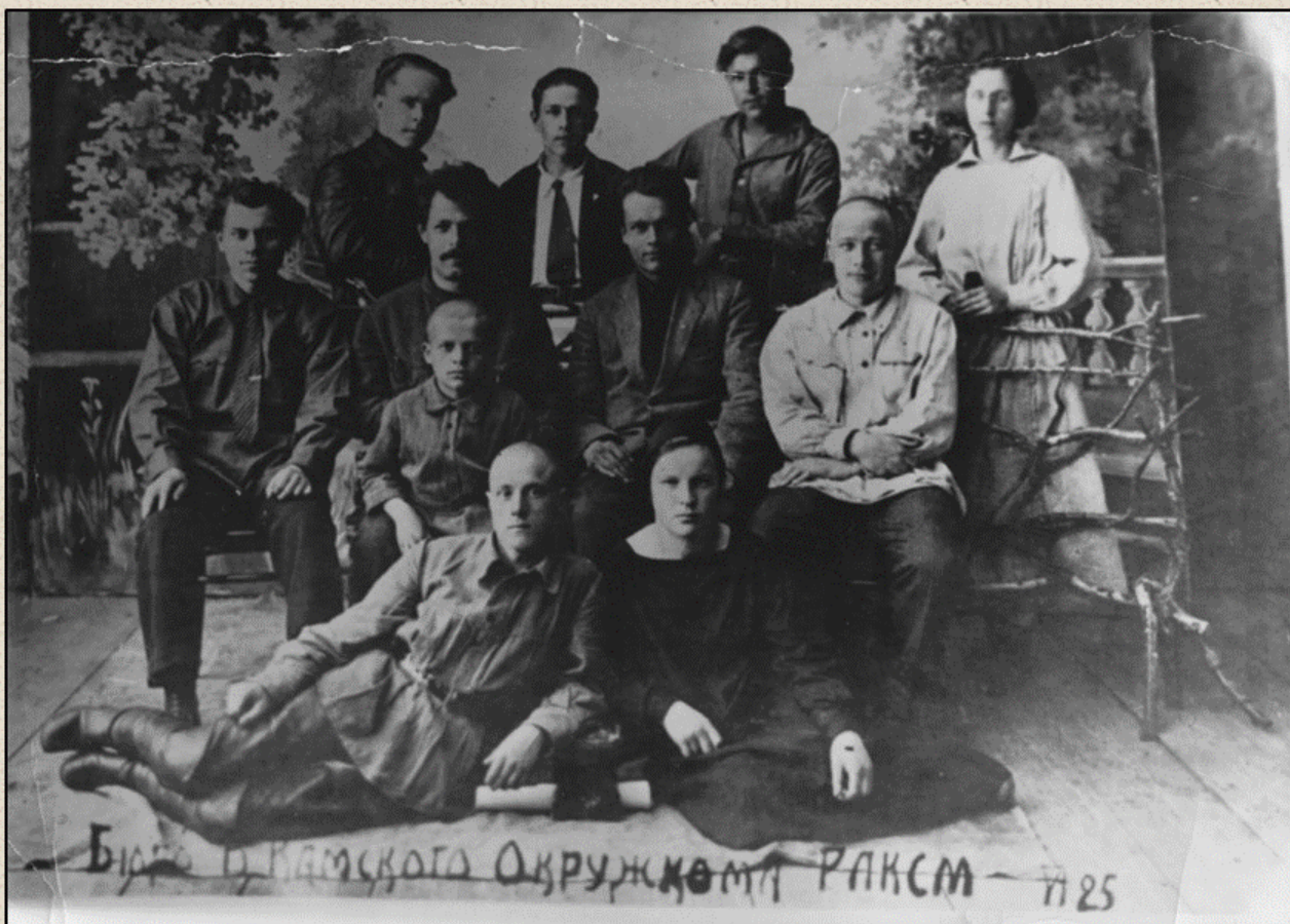
Бюро Верхне-Камского окружного РАКСМ, 1925 г.