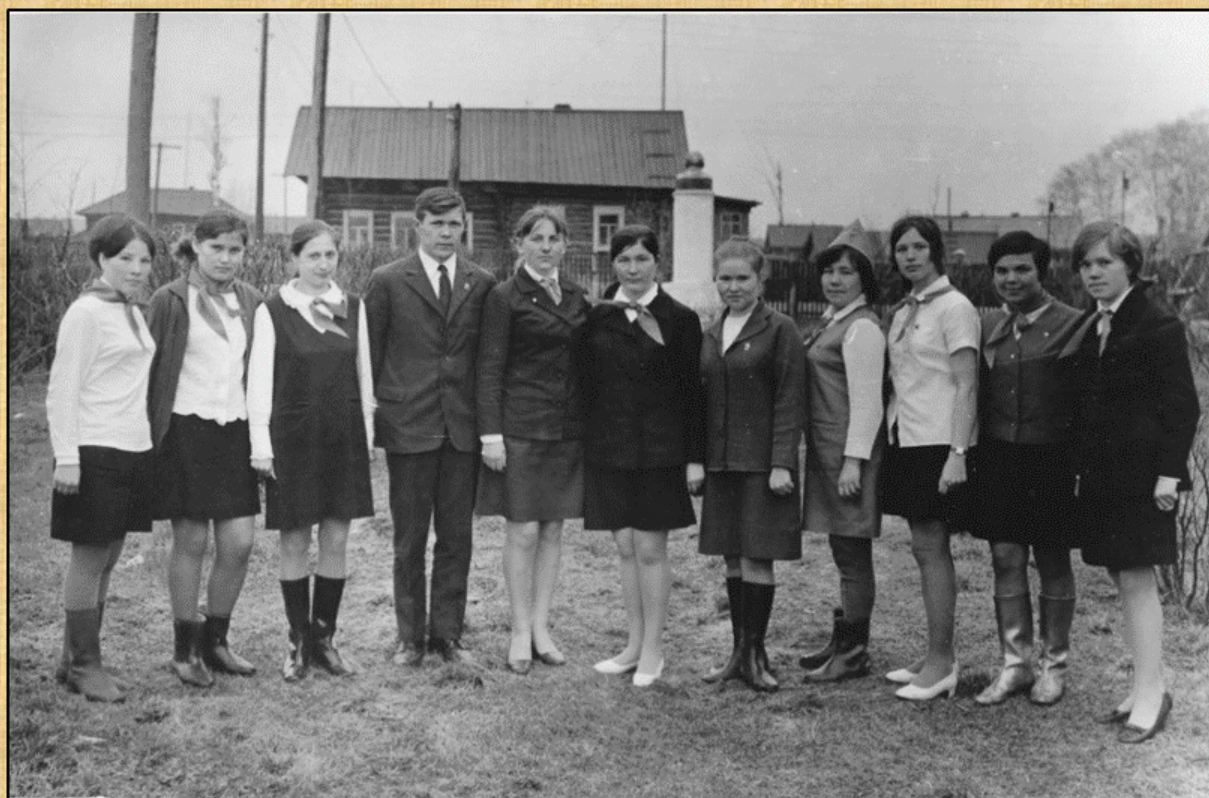
Работники комсомольской организации с пионерами, 1970 г.