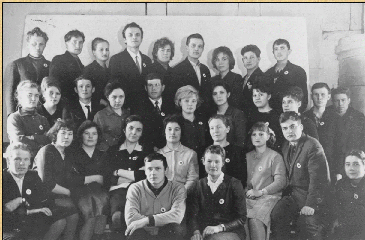
Делегация Юсьвинских работников комсомола на окружной конференции, сер. 1970-х гг.