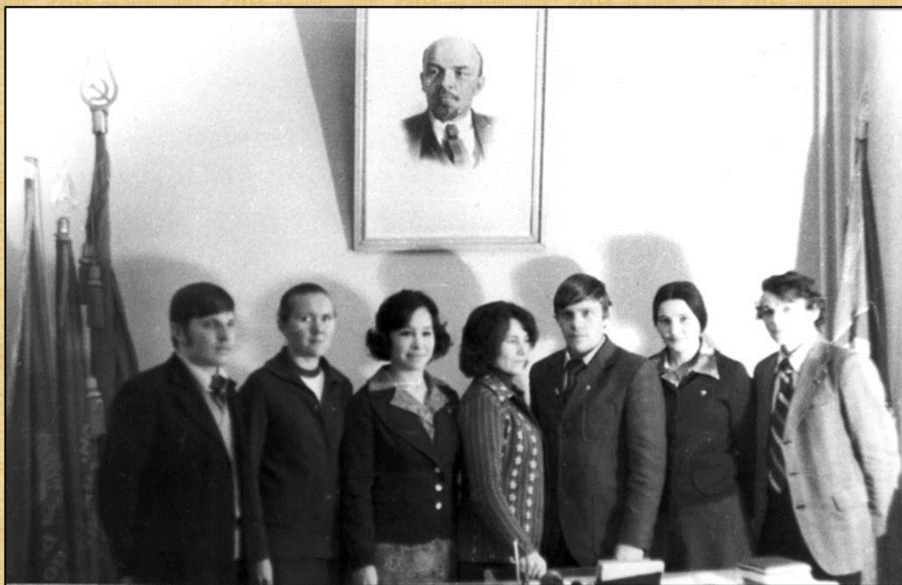
Аппарат Юридического РК ВЛКСМ, 1978 г.