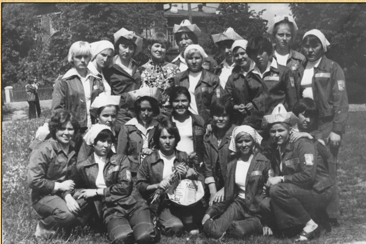
Студенты Коми-Пермяцкого сельхозтехникума из состава ССО-Астрахань, 1979 г.