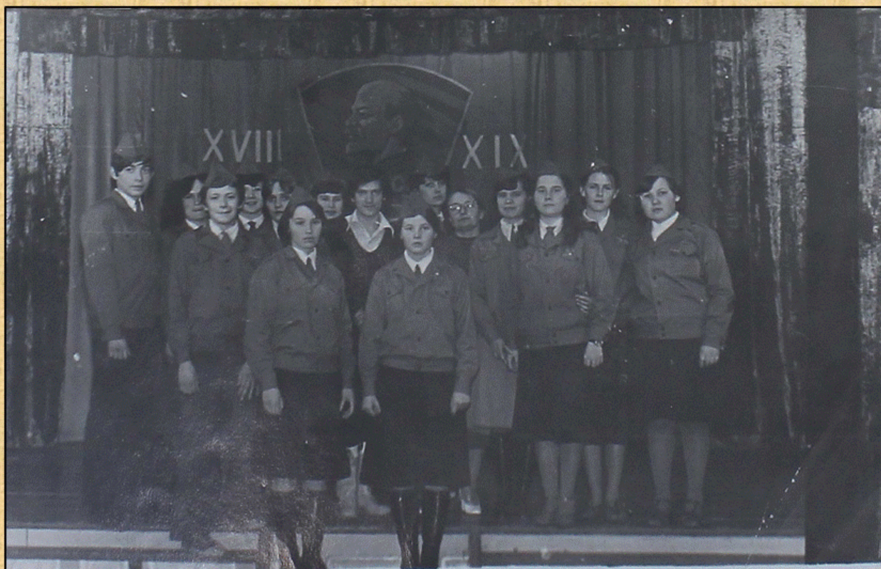
Концерт в сельхозтехникуме, посвященный XVIII съезду ВАСМ. Группа агрономов, 1978 г.