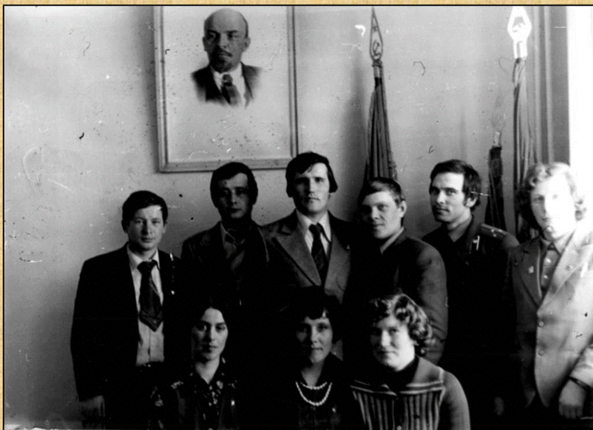
Состав бюро Юрянского РК ВЛКСМ, осень 1979 г.