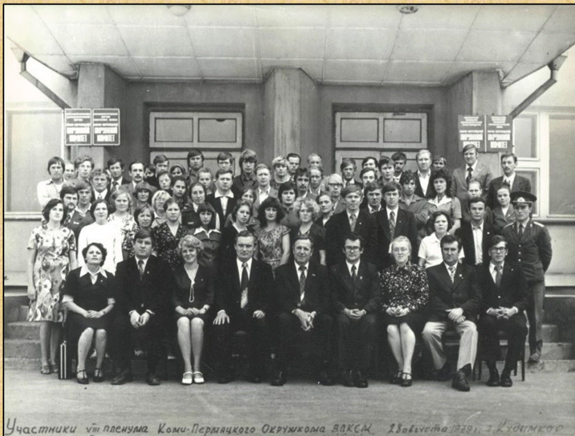
Участники VIII пленума Коми-Пермяцкого окружного ВЛКСМ. 28 августа 1979 г. Людямко