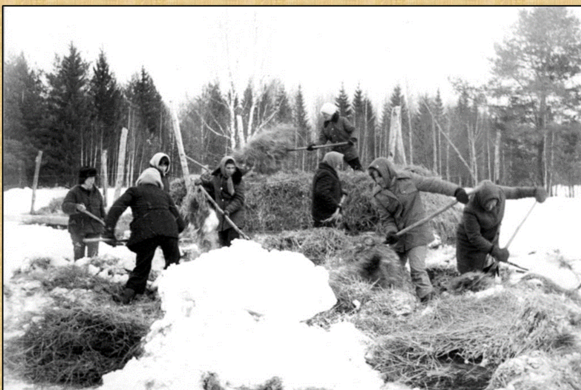
Комсомольцы Юринского РК ВАКСМ на подвозке кормов в д. Сергеево, 1978 г.