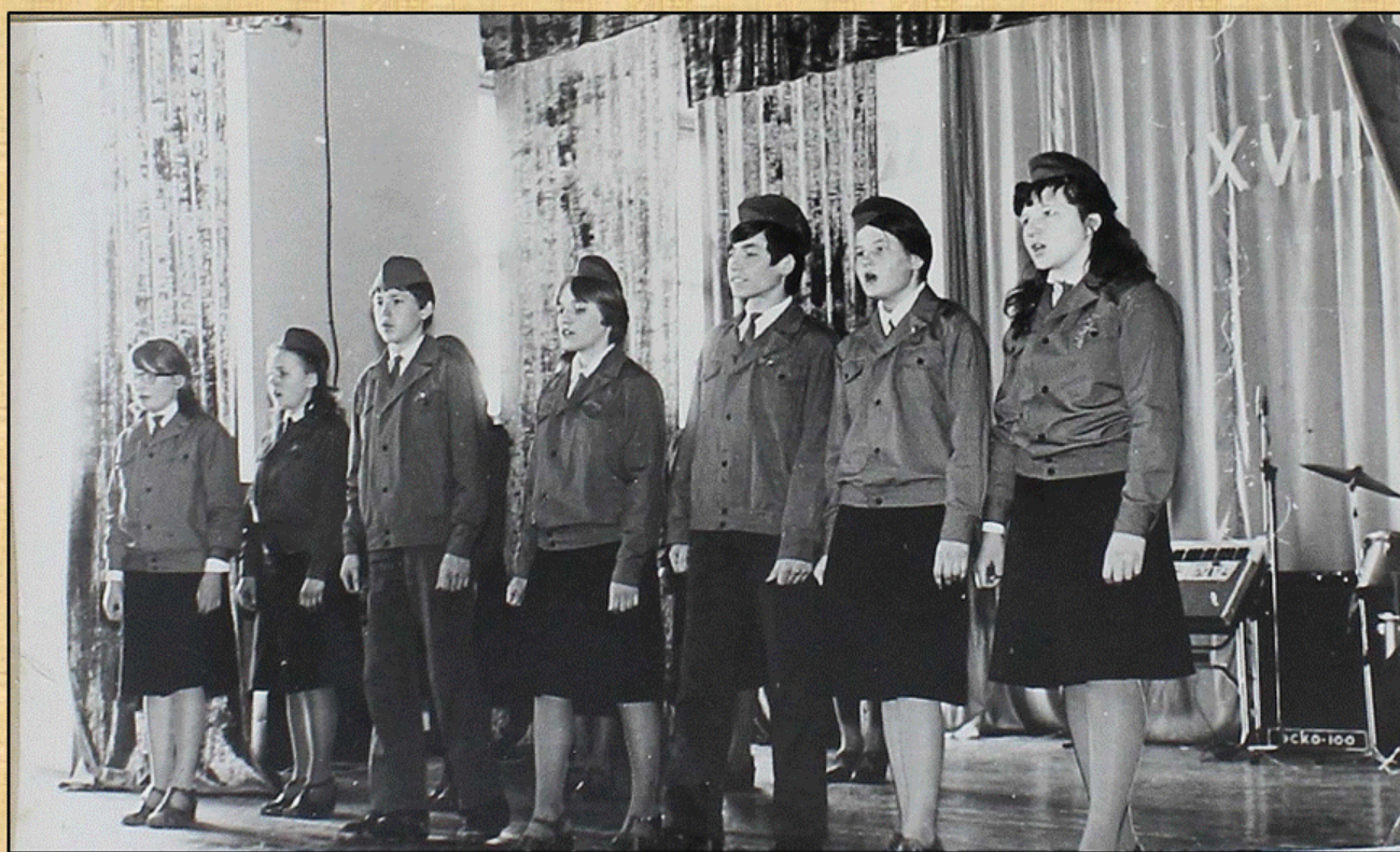
Концерт в сельхозтехникуме, посвященный XVIII съезду ВЛКСМ, 1978 г.