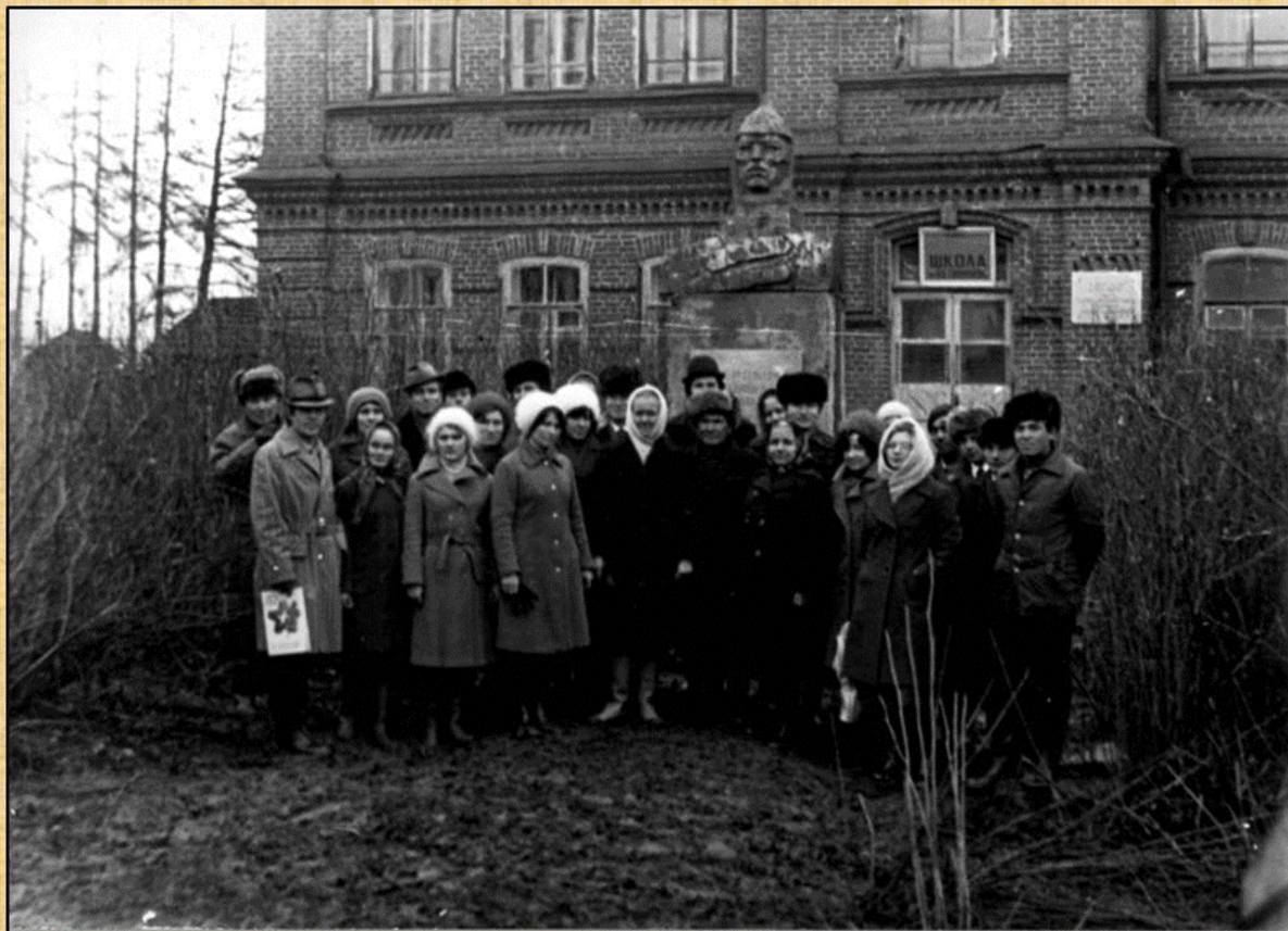
Комсомольцы и ветераны комсомола Юринского района после открытия памятника первым комсомольцам р-на, 28.10.1978 г.