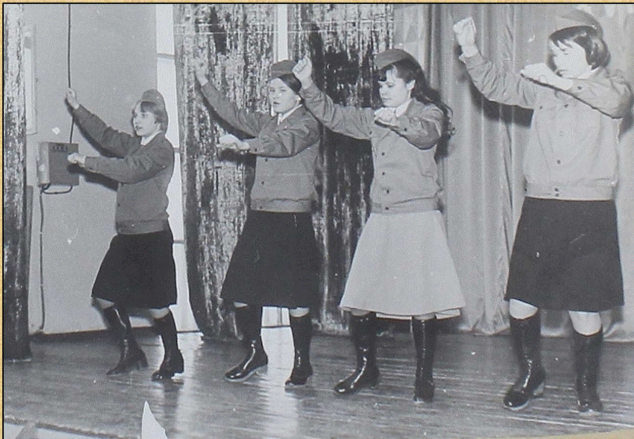
Концерт в сельхозтехникуме, посвященный XVIII съезду ВЛКСМ, 1978 г.