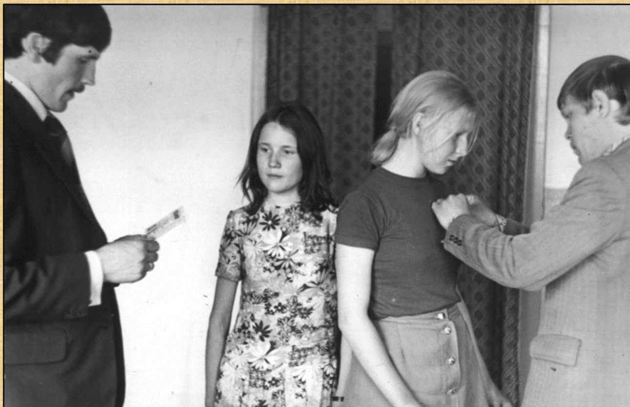
Обмен комсомольских билетов. с.Юрла, 1976 г.