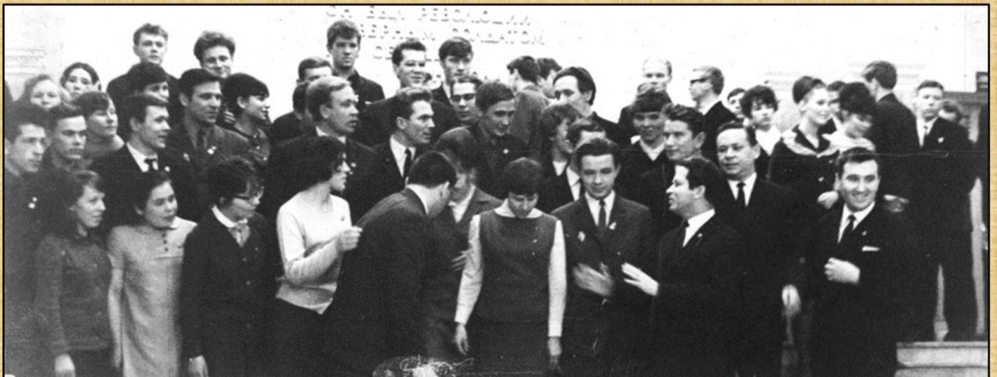
Делегаты окружной комсомольской организации на областной конференции. г.Пермь, 1970 г.