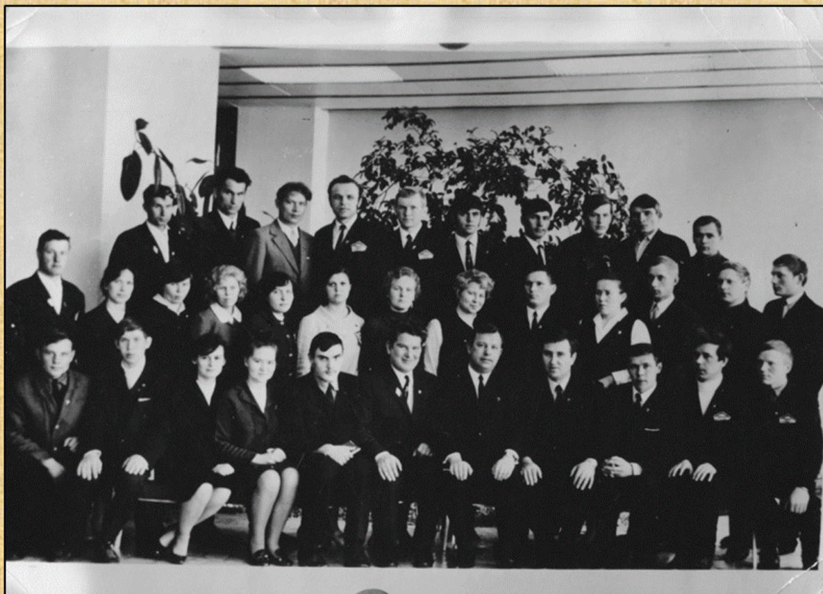
Делегация округа на областной комсомольской конференции. г. Пермь, 1973 г.