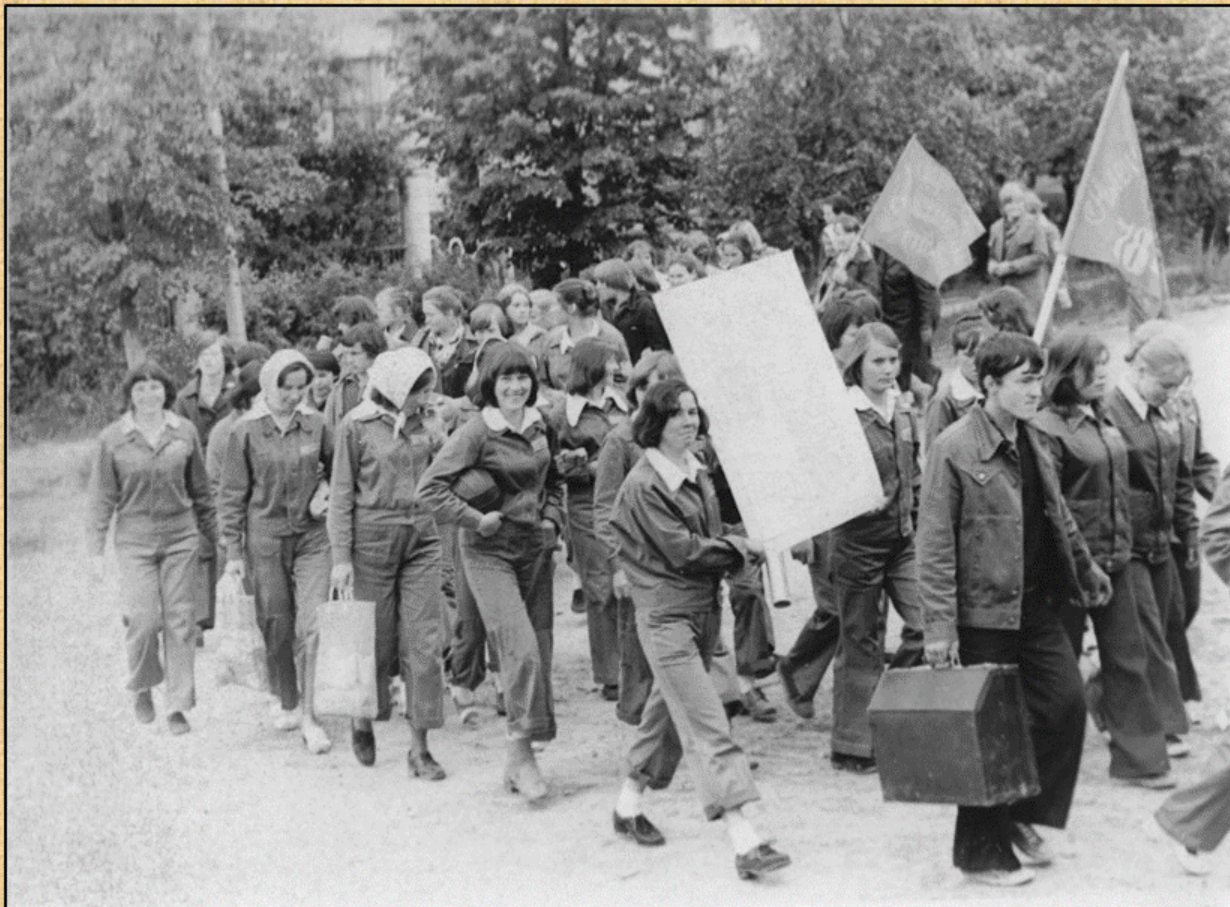
Колонна участников ССО на торжественном митинге, 1978 г.