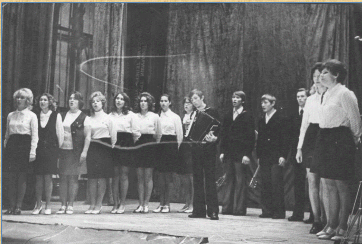
Конкурс комсомольской песни среди агитбригад Пермской области. г. Очёр, 1977 г.