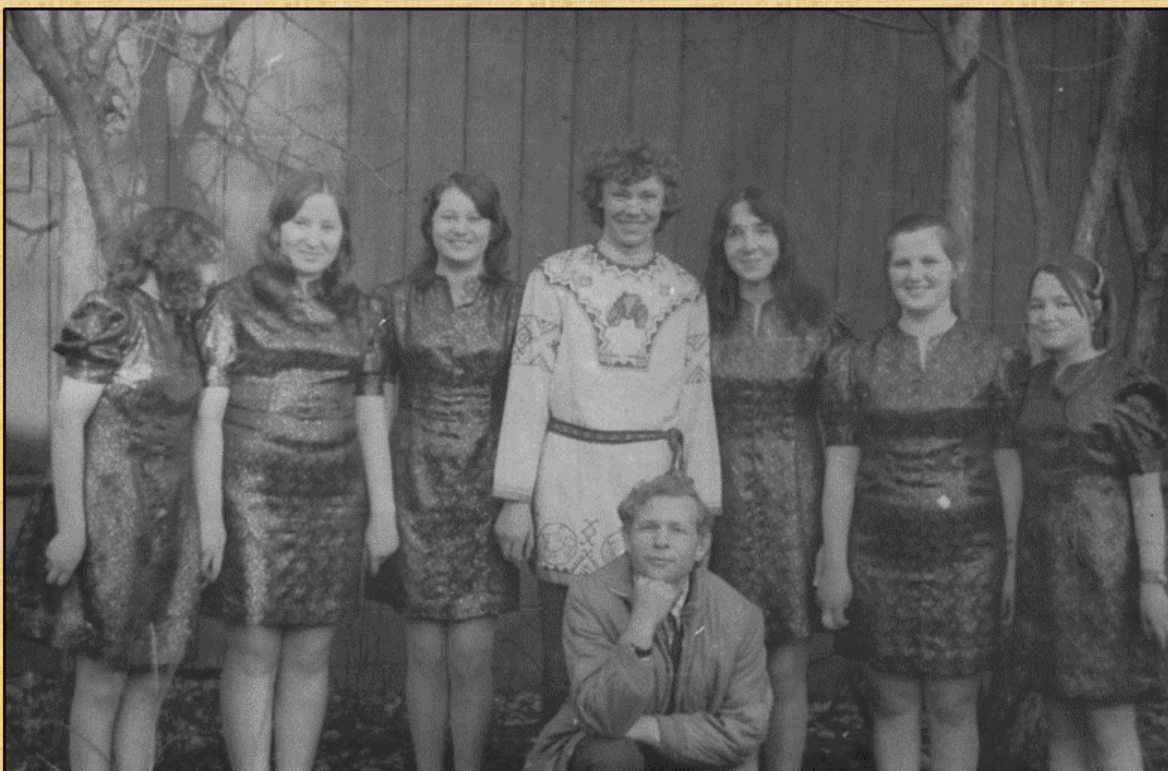
Хор «Кантилена» нар. ансамбля песни и танца Коми-Пермяцкого сельхозтехникума, лауреат премии Пермского комсомола, 1975 г.