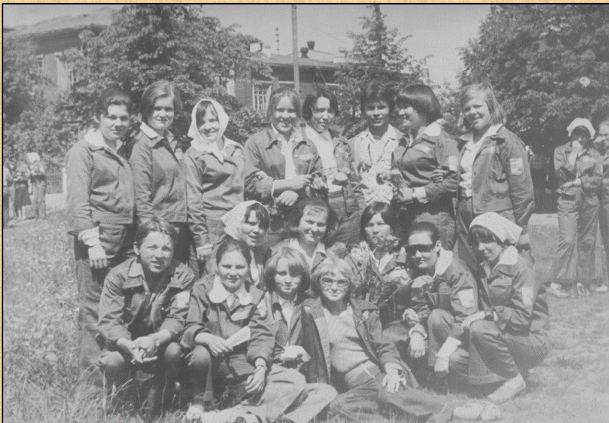
Студенты Коми-Пермяцкого сельхозтехникума из состава ССО-Астрахань, 1979 г.