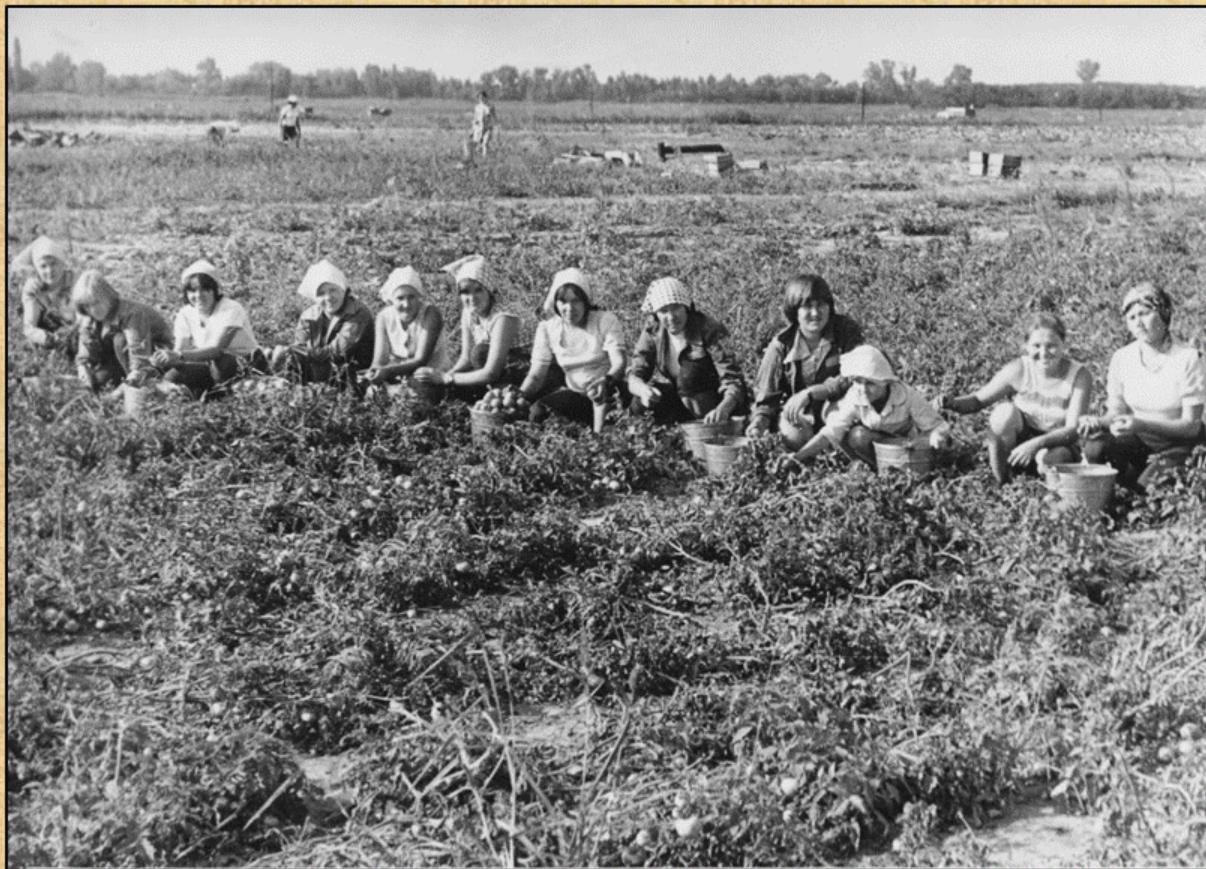
Студенты Коми-Пермяцкого сельхозтехникума из состава ССО на работе в Астрахани, 1979 г.