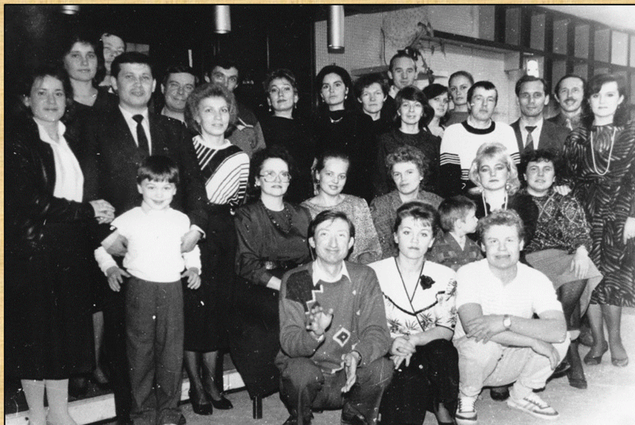
Вечер встречи комсомольцев в кафе "Рябинушка", 25.10.1991 г.