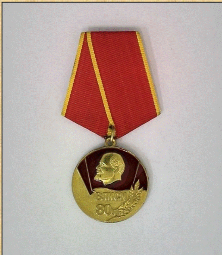
Юбилейная медаль "80 лет ВЛКСМ", 1998 г.